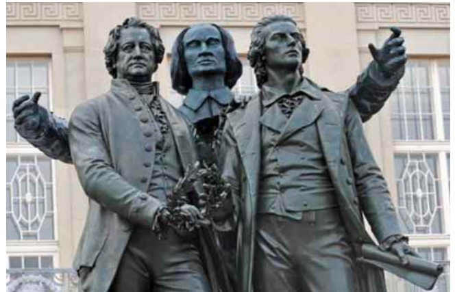
Goethe-Schiller-Denkmal in Weimar – im Jubiläumsjahr mit Franz Liszt

Und wir müssen Franz Liszt hoch anrechnen, dass er seine Erfahrungen an den Nachwuchs weitergab. Die Weiterentwicklung der Technik des Klavierspiels und der pianistische Umgang mit neuen Klangformen bis in unsere Zeit gehen massgeblich auf sein Wirken als Lehrer zurück. Zu seinen grossen Verdiensten zählt die Gründung der Königlich-Ungarischen