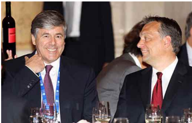
Deutsche Bank-Chef Josef Ackermann im Gespräch mit Ungarns Regierungschef Viktor Orbán am Wiener Bankengipfel.

Ja, das weltweite Wirtschaftswachstum hält unvermindert an. Angesichts der europäischen Staatsschuldenkrise haben sich die Befürchtungen um eine straffere Geldpolitik in China vorerst gelegt. Die jüngst veröffentlichten Zahlen vom US-Arbeitsmarkt schürten jedoch die Angst vor einem Anstieg der Arbeitslosigkeit. Positiv ist indes, dass die Familieneinkünfte in den USA im zweiten Quartal wohl um rund 5 % gestiegen sind. In der Eurozone schreibt derzeit nur Griechenland negative Wachstumszahlen. In anderen Ländern der Eurozone legte das Wirtschaftswachstum im zweiten Quartal abermals zu und stieg aufs Jahr gerechnet von 2,0 % auf 3,0 %. Insgesamt findet zurzeit eine Stabilisierung der Haushaltsdefizite statt (ausser in Griechenland).